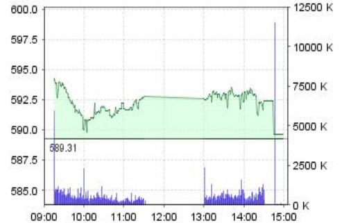
VN-Index: Kết quả giao dịch